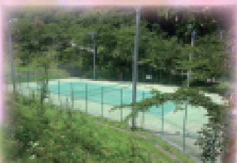
館山テニスコート (船岡城址公園内)